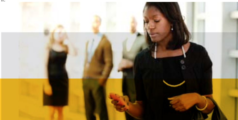
Figura 1. Le versioni di OpenTouch™ soddisfano le esigenze delle aziende e dei service provider.

È la soluzione ideale per le aziende che vogliono usufruire di tutti i vantaggi delle conversazioni collaborative di OpenTouch™ in un ambiente multi fornitore esistente. OpenTouch™ Federation Services funziona con OpenTouch™ Business Edition e OpenTouch™ Multimedia Services.